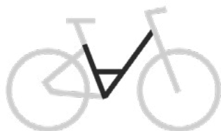
Wave (bequemer Einstieg)